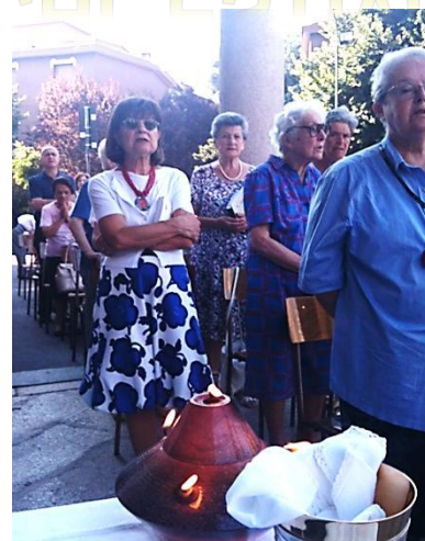
S. Messa all'aperto per sfuggire al grande caldo