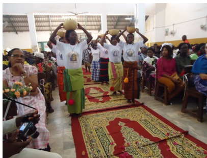
Una messa con danza in Bissau prima del Covid