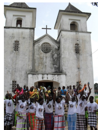
La chiesa di Catio