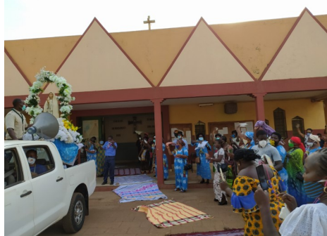
Arrivo della statua della Madonna in parrocchia in occasione della processione della Madonna di Fatima per le vie di Bissau lo scorso anno: solo con la macchina e la statua causa Covid ma con tanta gente per le strade.